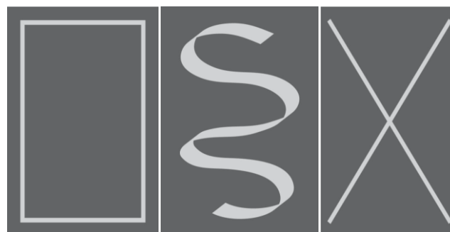
Figura 2: Aplicaciones no recomendadas